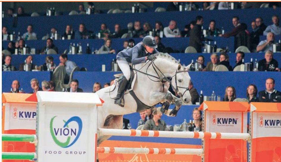
De kwaliteitsvolle Up to Date heeft via zijn nazaten al vele successen geboekt. Zo is hij vader van IBOP-topper Bumosa, Nationaal Veulenkampioen Belmondro en Hengstenkeuringskampioen Cosun.

In Nederland werd hij uitgebracht door Mareille Schröder. Als driejarige kreeg hij een 8 voor de aanleg als springpaard, waarbij werd opgemerkt dat hij iets patenter zou mogen zijn en met een iets open voorbeen springt. Daarnaast toonde hij zich voldoende voorzichtig en sprong hij met veel vermogen. De Iroko-zoon Undercover (uit Origina v.Libero H) heeft in Nederland ook prestaties op 1.30m-niveau geleverd nadat hij als driejarige werd ingeschreven met een 8 voor de aanleg als springpaard. In het verrichtingsverslag wordt hij omschreven als een sensibele hengst die snel is afgeleid, maar vlug en krachtig van de grond springt en heel goed kan terugspringen. Ook het lichaamsgebruik en de sprongafloop zijn positieve punten van Undercover. In 2007 is de hengst met oog op de sport verkocht naar Amerika. Eén hengst slaagde via de herkeuring, met een aanlegcijfer van 7. Deze Karandasj-zoon Unesco (uit Pico Bello elite sport-(spr) v.Caretino) werd op vierjarige leeftijd via de herkeuring ingeschreven. In het verrichtingsverslag staat vermeld dat de hengst tijdens het springen nog wat strak en recht in de bovenlijn blijft en dat hij de achter-