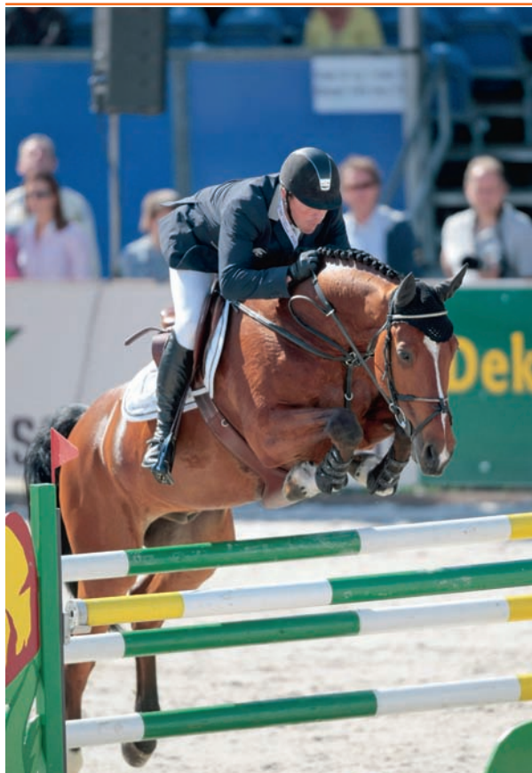
De getalenteerde hengst Ultimo lijkt zelf alles in huis te hebben voor het hogere werk en valt op in de fokkerij dankzij diverse sublieme dochters op keuringen en IBOP.

In Nederland werd hij uitgebracht door Mareille Schröder. Als driejarige kreeg hij een 8 voor de aanleg als springpaard, waarbij werd opgemerkt dat hij iets patenter zou mogen zijn en met een iets open voorbeen springt. Daarnaast toonde hij zich voldoende voorzichtig en sprong hij met veel vermogen. De Iroko-zoon Undercover (uit Origina v.Libero H) heeft in Nederland ook prestaties op 1.30m-niveau geleverd nadat hij als driejarige werd ingeschreven met een 8 voor de aanleg als springpaard. In het verrichtingsverslag wordt hij omschreven als een sensibele hengst die snel is afgeleid, maar vlug en krachtig van de grond springt en heel goed kan terugspringen. Ook het lichaamsgebruik en de sprongafloop zijn positieve punten van Undercover. In 2007 is de hengst met oog op de sport verkocht naar Amerika. Eén hengst slaagde via de herkeuring, met een aanlegcijfer van 7. Deze Karandasj-zoon Unesco (uit Pico Bello elite sport-(spr) v.Caretino) werd op vierjarige leeftijd via de herkeuring ingeschreven. In het verrichtingsverslag staat vermeld dat de hengst tijdens het springen nog wat strak en recht in de bovenlijn blijft en dat hij de achter-