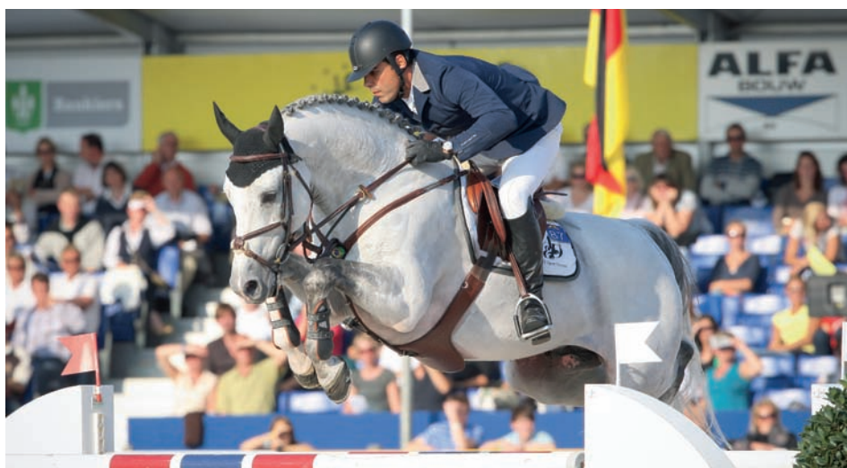
De Hors La Loi II-zoon Untouchable maakt met zijn prestaties in de internationale sport de hoge verwachtingen, die van hem als jong paard ontstonden, volledig waar.