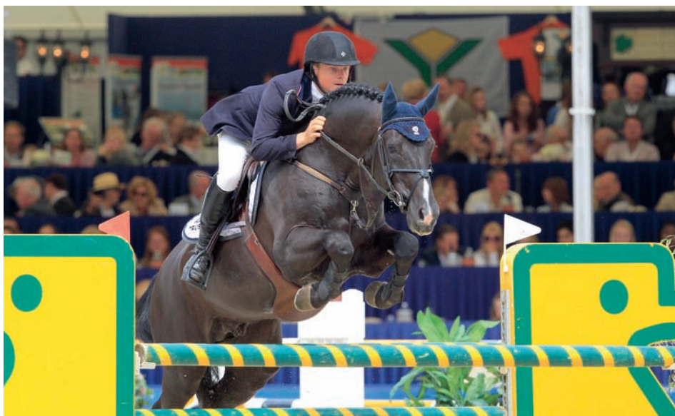
De derde Grand Prix-hengst van de U-jaargang is de fantastisch springende Ukato (v.Stakkato), die als driejarige al met droomcijfers werd ingeschreven.

viel hij als driejarige al enorm op met zijn vrijspringkwaliteiten, maar mocht hij geen ronde verder vanwege exterieurmatige bedenkingen. Via de herkansing onder het zadel werd de hengst alsnog aangewezen voor het najaarsonderzoek. "Als driejarige was het een net gemodelleerde hengst die iets klassiek aan deed, maar die eigenlijk steeds mooier is geworden. Hij was ongehooflijk compleet in zijn verrichting, topvoorzichtig, met zeer veel vermogen en een fantastische instelling. Hij is zich daarna ook heel goed blijven ontwikkelen en is eigenlijk met twee vingers in de neus doorgegroeid naar de internationale sport." Ook jaargenoot Unaniem (Numero Uno uit Passivona keur pref v.Voltaire) springt op