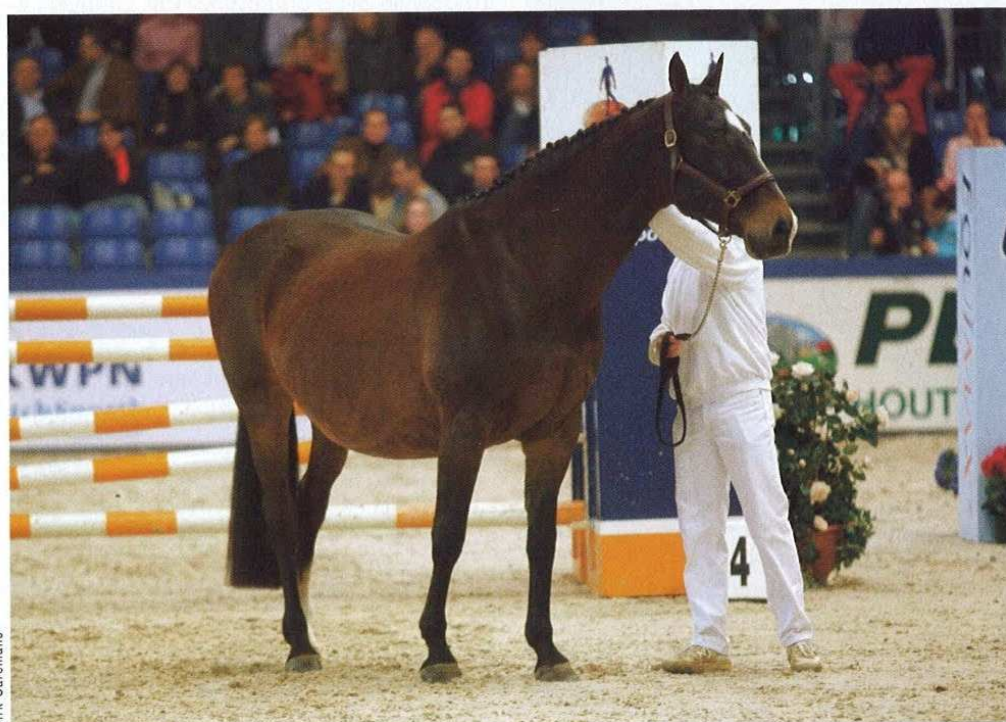
De moeder van Namelus R Eamelusiena (v.Joost) in het showblok van de keur verklaarde hengsten in Den Bosch.

Zijn kinderen springen bijzonder vlug, openen de achterhand heel goed en tonen zeer veel vermogen, zeer veel souplesse en zijn daarbij bijzonder voorzichtig. Zijn fokwaarde voor het vrijspringen is met 113 punten en een betrouwbaarheid van 76% dan ook bijzonder hoog.