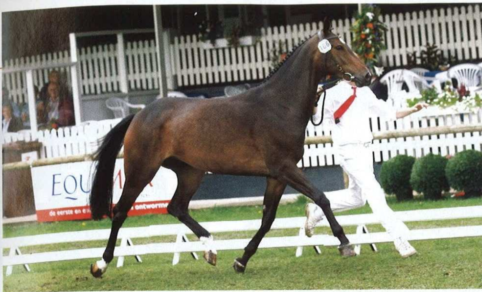
Namelus R-kleindochter Zuliza was vorig jaar, na een goede merrietest, de beste van de Overijsselse springmerries en nam deel aan de NMK.

door zijn instelling, hij wilde altijd werken. Dat heeft hij van zijn moeder en zijn vader en hij geeft het dus dubbel door aan zijn kinderen, die zijn allemaal gruwelijk werkwil- lig en voorzichtig. Daarnaast zijn ze eerlijk en betrouwbaar, terwijl ze tegelijkertijd veel 'bloed' hebben. In mijn ogen moet een springpaard 'bloed' hebben, maar liever bekend 'bloed' uit onze eigen stam dan dat we een onbekende volbloed moeten gebrui- ken. Naast veel springaanleg geeft Namelus R ook een fraai exterieur door. Donkere, langgelijnde paarden met veel hals en altijd bergop gebouwd. Daar hou ik van. De gan- gen zijn goed, vooral de galop. Hij staat nu nog thuis maar voor het dekseizoen gaat hij naar dekstation Ardts in Haps."