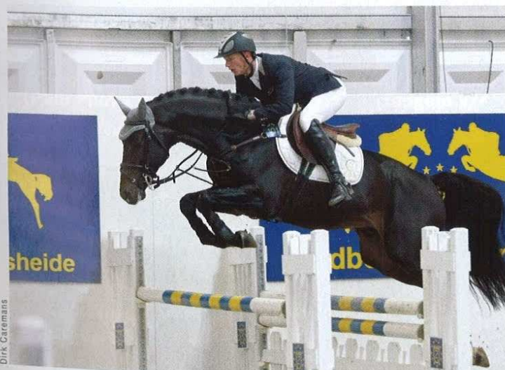
Nintender eindigde als tweede in het verrichtingsonderzoek voor springpaarden in Oldenburg met maar liefst een tien voor springvermogen.