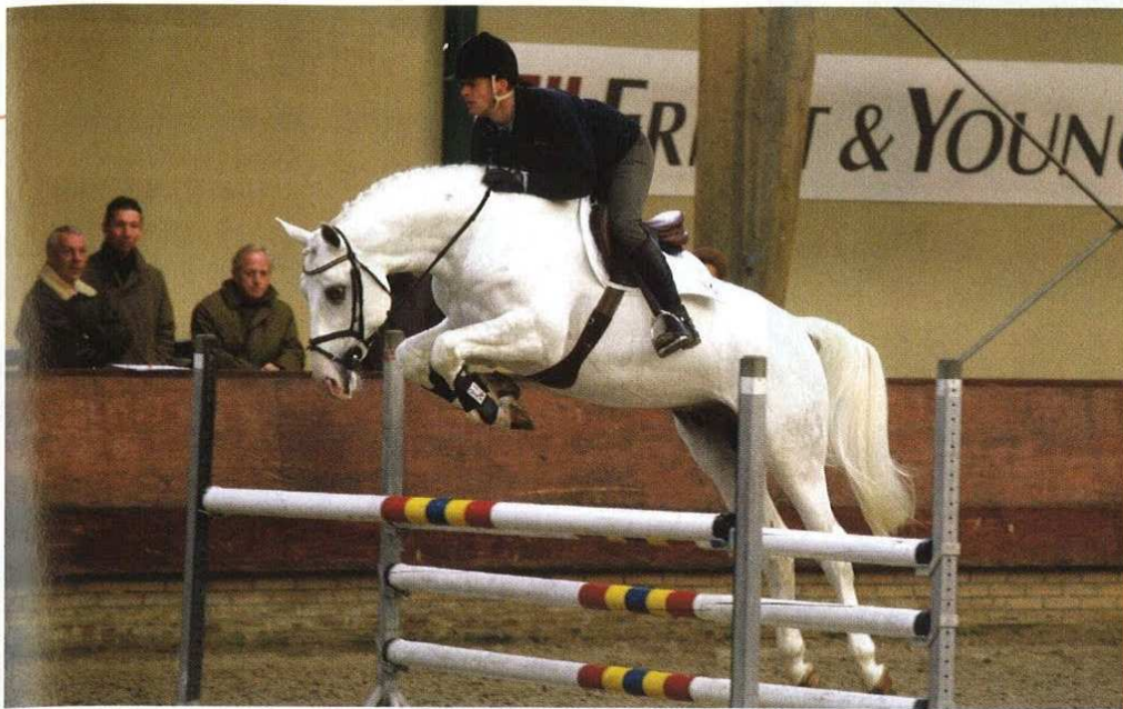
De goedgekeurde hengst Eurocommerce Zürich, springkampioen van de hengstenkeuring 2007 en verrichtingskampioen van het najaarsonderzoek, is een zoon van de volle zus van Larino.