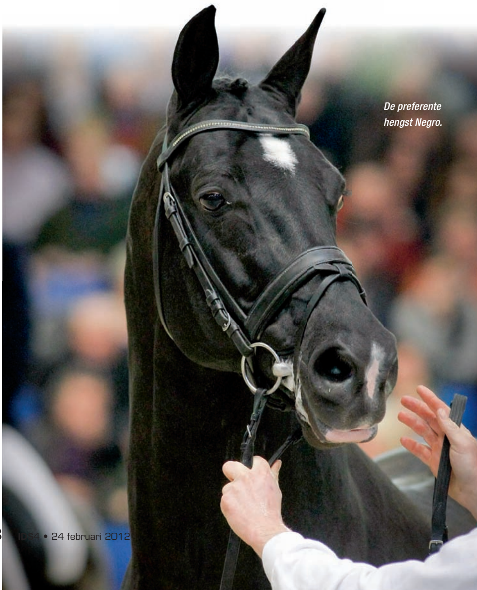
De preferente hengst Negro.

“Dit is een paard voor de grote ring.” Het is het jurycommentaar na het optreden in de finale van het WK voor jonge dressuurpaarden in het jaar 2001. En het ging over de toen zesjarige hengst Negro, die daar als beste KWPN'er eindigde. Achteraf gezien hadden de kwaliteiten van de zwarte Ferro-zoon niet treffender omschreven kunnen worden. Al bracht de hengst het door een vervelende blessure in de sport uiteindelijk nooit tot het hoogste niveau. Maar er is één geluk: Negro fokt, zoals hij zelf is. En nu schitteren zijn nakomelingen in de Zware Tour en blinken uit in de oefeningen waar optimale verzameling voor wordt gevraagd. Zij zijn nu de paarden voor de ‘grote ring’, oftewel de Grand Prix. En dat is één van de redenen dat Negro dit jaar het allerhoogste predicaat voor een goedgekeurde KWPN-hengst toegekend kreeg: het preferentschap.