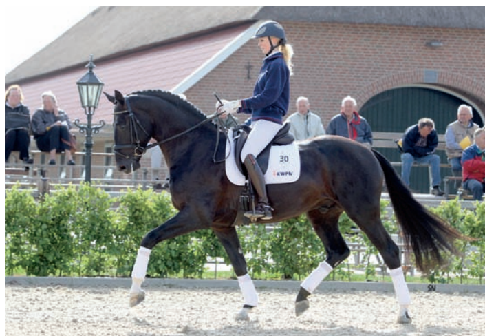
Diego (Negro x Don Gregory) werd verleden jaar na het verrichtingsonderzoek ingeschreven in het stamboek, en geldt als een beloftevol paard voor de toekomst.