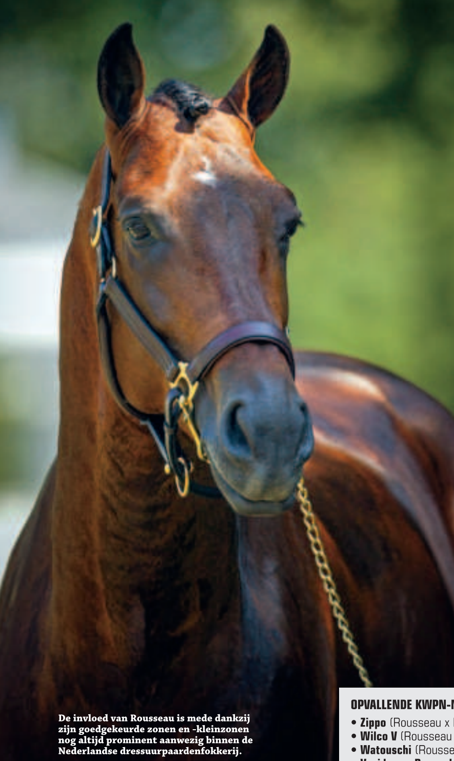
De invloed van Rousseau is mede dankzij zijn goedgekeurde zonen en -kleinzonen nog altijd prominent aanwezig binnen de Nederlandse dressuurpaardenfokkerij.